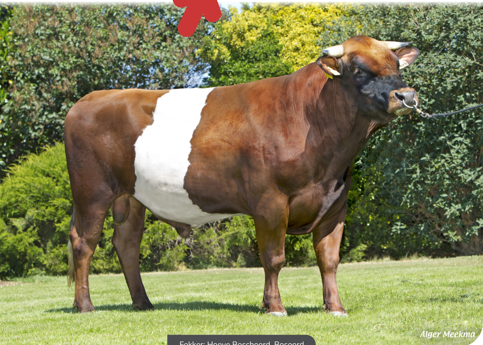
Fokker: Hoeve Boschoord, Bosoord