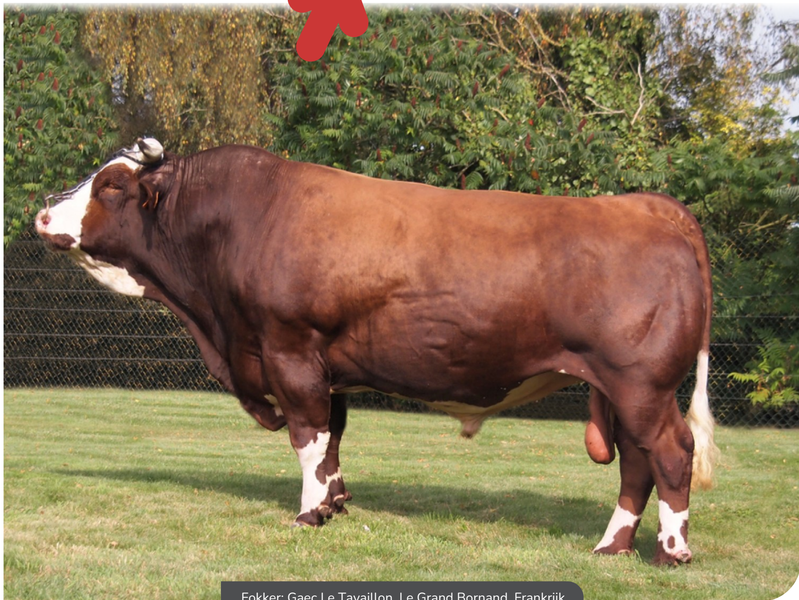
Fokker: Gaec Le Tavaillon, Le Grand Bornand, Frankrijk