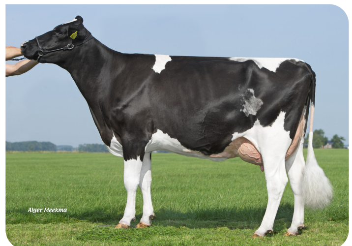
Koolstein Trijntje 493 (v. Fletcher) Eig.: VOF Kool, Appingedam