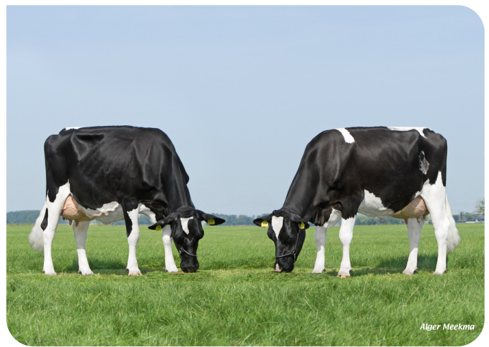
Koolstein Akke 183 (l) en Koolstein Trijntje 493 (r) (v. Fletcher) Eig.: VOF Kool, Appingedam