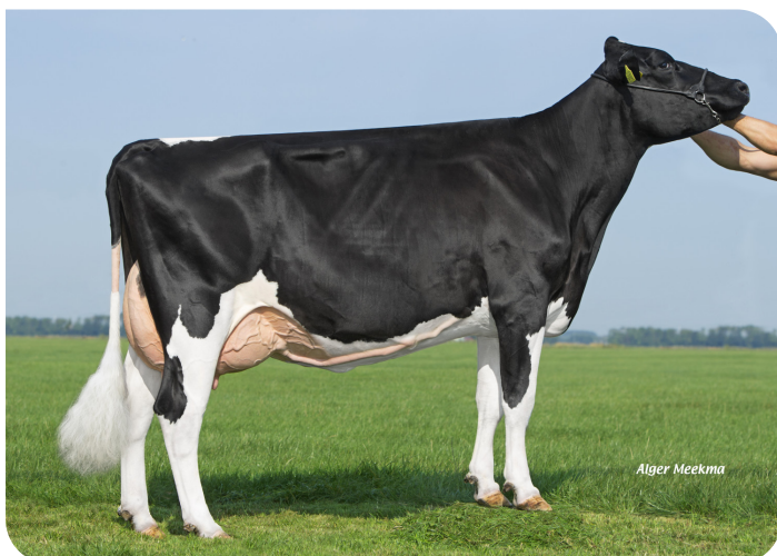
Koolstein Akke 183 (v. Fletcher) Eig.: VOF Kool, Appingedam