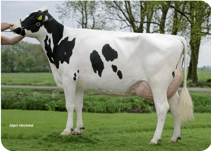
Mastenbroeker Akke 870 (A 90) (moeder van Fletcher)