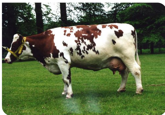
Merlin 29 (moeder van Gerbert)