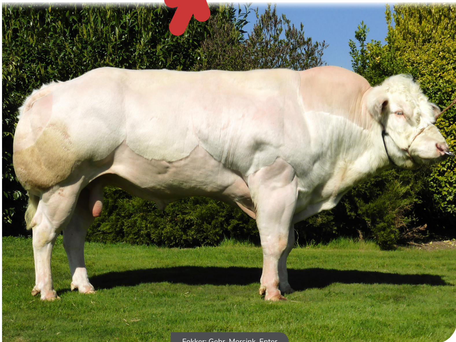
Fokker: Gebr. Morsink, Enter