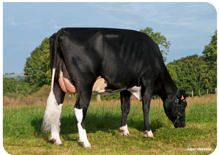
Falsamine Overgrootmoeder van Neal