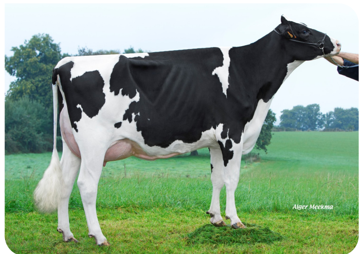
Jideale Moeder van Neal