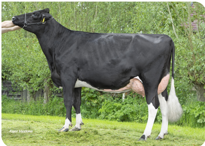
Plataan F 7888 (AB 87) Moeder van Faster