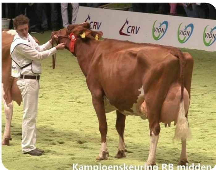
Kampioenskeuring RB midden

P.M. Elza 159 (EX 91) (moeder van Elver rf)