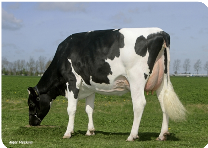
Sophie 180 (v. Maniac PS) Eig.: Dhr. M. Chattellon, Abbekerker