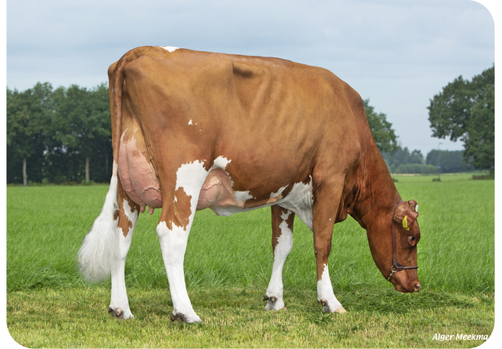
Grashoek Jessie 46 (AB 86) (v. Fame P) Eig.: Melkveebedrijf Grashoek b.v., Grashoek