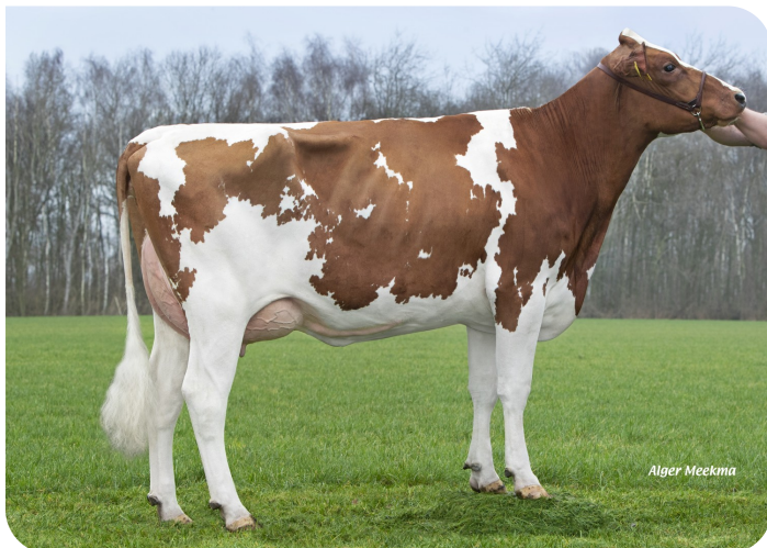
Grashoek Boukje 519 (v. Fame P) Eig.: Fok- en melkveebedrijf K.I. Samen B.V., Grashoek