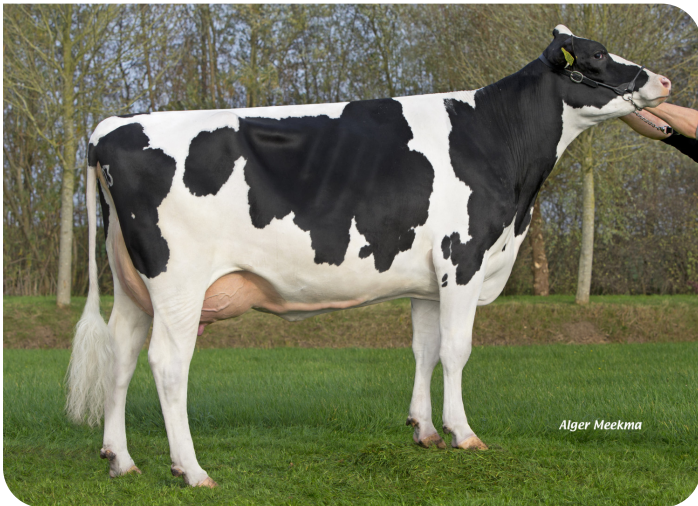
Poppe Fienchen 803 (AB 86) (Grootmoeder van Fame P)