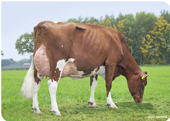
Grashoek Jessie 46 (AB 88) (lact. 2) (v. Fame P) Eig.: Melkveebedrijf Grashoek b.v., Grashoek