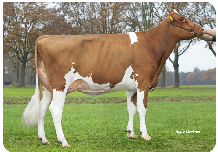
Kooifarm Lilly 7 (v. Fame P) Eig.: Klein Baltink C.V., Kring van Dorth