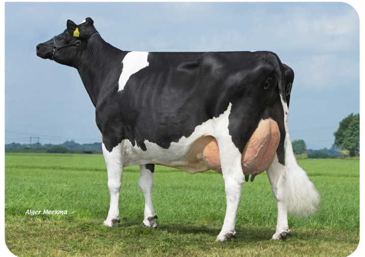
Poppe Fienchen 580 (AB 88) (Overgrootmoeder van Fame P)