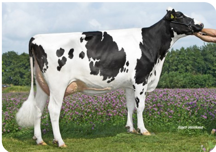
Wilder K41 RDC (AB 87) (Moeder van Kayne)