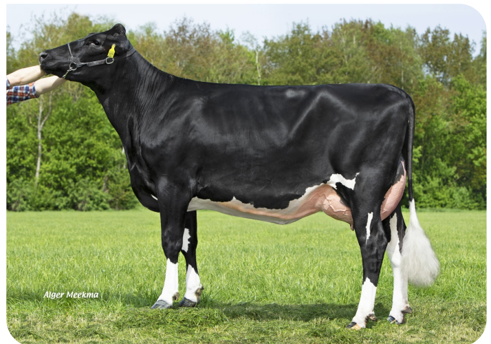
Grashoek Mona-Lisa 47 (V. Kayne) Eig.: Fok- en melkveebedrijf K.I. Samen B.V., Grashoek (NL)