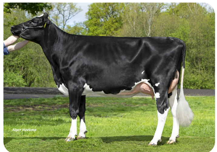
Diekers 3Star Ka Ida 3 (v. Kayne)