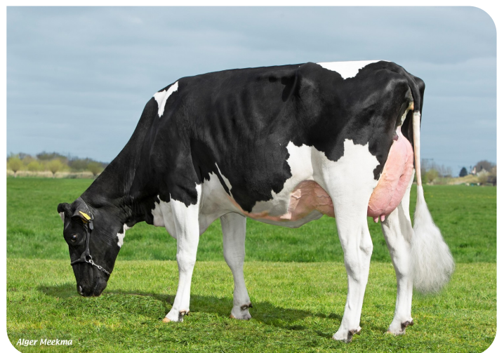
Poppe Red Hot Feather(AB 87) Moeder van Freebird Red