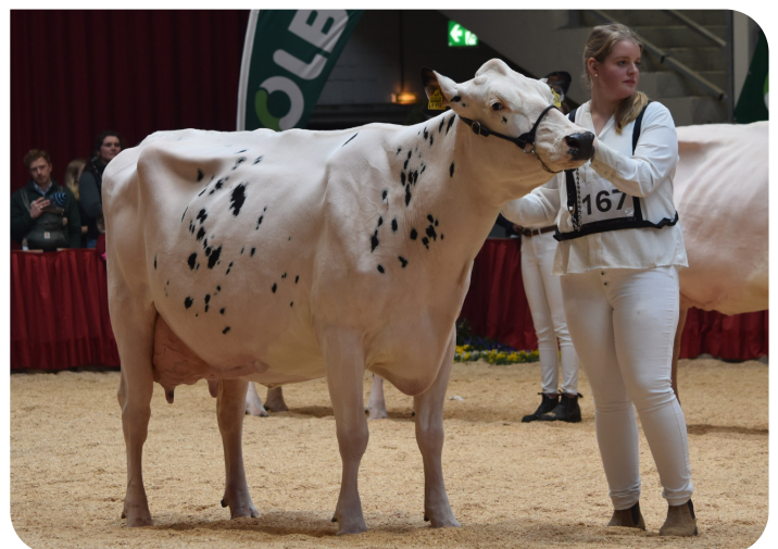
Irose 42 Moeder van Primrose