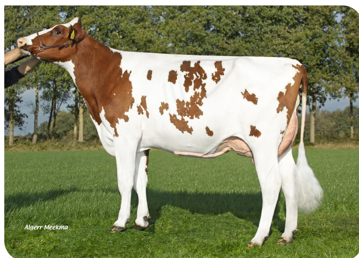
Red Rocks Massia 216 P (AB 87) Moeder van Martian Red PP