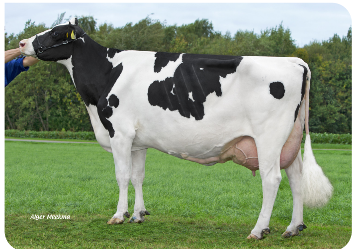
Wilgenhoeve Wizzy 3 (A90) (v. Norwin rf) (foto als 6de kalfs) Eig.: Mts. Groenen, Middelaar