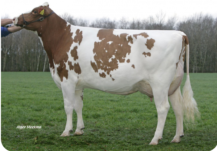
Irma 28 (v. Norwin rf) Eig.: V.O.F. Gebleektendijk, Nederweert-Eind