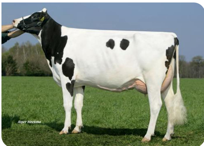
Everett 3 (AB 86) (v. Norwin rf) Eig.: Melkveehouderij Verwielen v.o.f., Hunsel