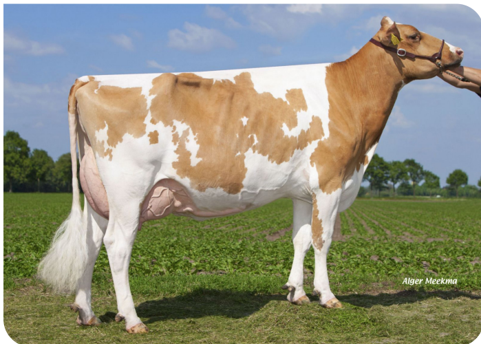
Grashoek Blutchen 51 (A 90) (v. Norwin rf) (foto als 2de kalfs) Eig.:Melkveebedrijf Grashoek b.v., Grashoek