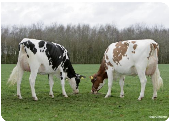
Maga 75 & Irma 28 (v. Norwin rf) Eig.: V.O.F. Gebleektendijk, Nederweert-Eind