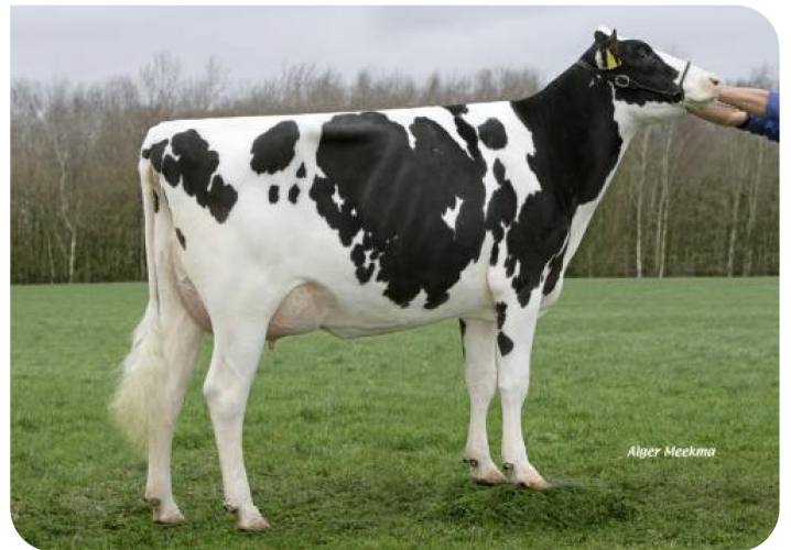
Maga 75 (v. Norwin rf) Eig.: V.O.F. Gebleektendijk, Nederweert-Eind