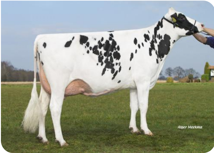
Grashoek Angel 51 (v. Norwin rf) Eig.: Melkveebedrijf Grashoek b.v., Grashoek