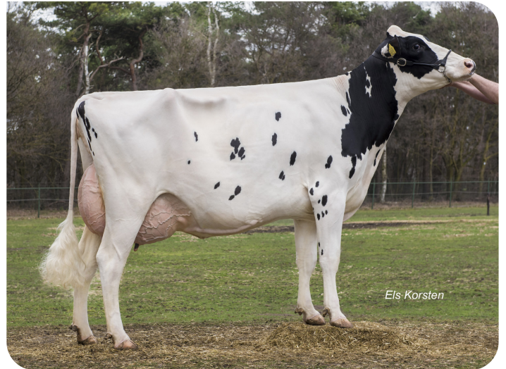
Angels Wiesje 46 (v. Norwin rf) Eig.: Angels Holsteins, Meijel