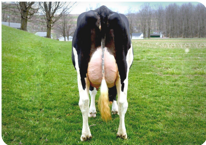
Scenic-Vista Ardels Raya-ET-P Volle zus van Radix-P rf Eig.: Scenic-Vista Farms, Western Maryland, USA