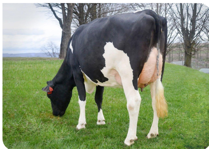
Scenic-Vista Ardels Raya-ET-P Volle zus van Radix-P rf Eig.: Scenic-Vista Farms, Western Maryland, USA