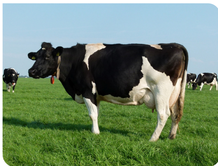
Setske 244 (moeder van Sem 17)