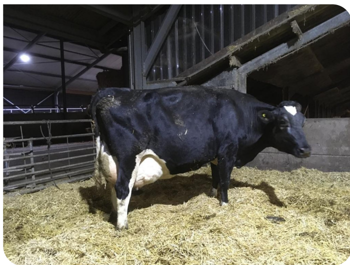
Elsje 184 (moeder van Silvester)