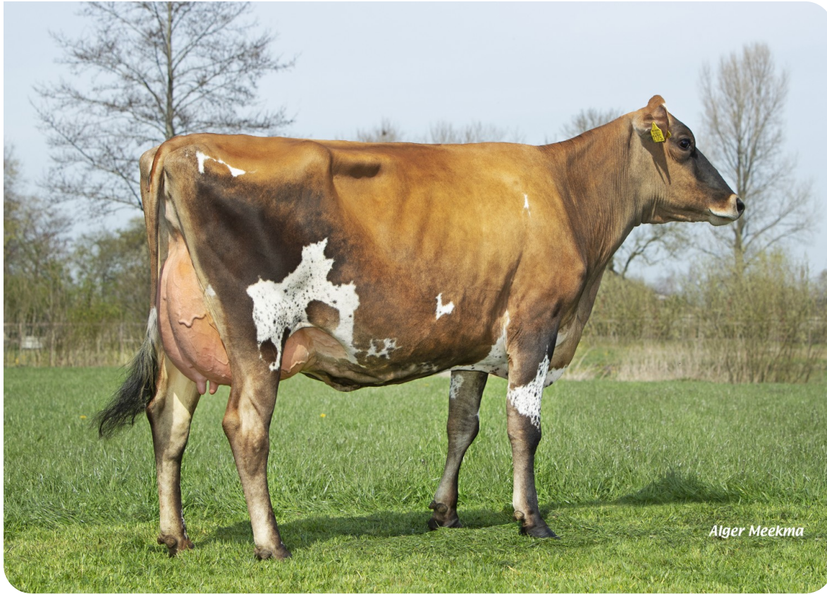
Bossink Dies 57 (v. Sullivan, 50% Jer./50% RHF)

Eig.: Van der Kolk Melkvee V.O.F., Wierden