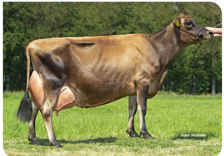
Missy 9490 (volle zus van Sullivan) (foto als 4de kalfs)