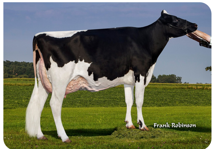
Golden-Rose Abs Gloriana Grootmoeder van Genesis