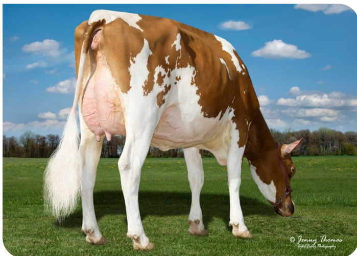
Golden-Rose Ladd Glory-Red (AB86) Moeder van Genesis