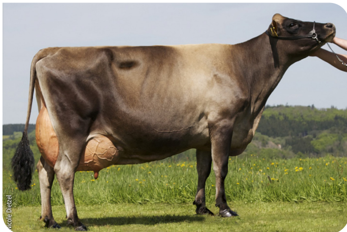
Scholz Evita (PP) (A 91) moeder van Napoleon PP