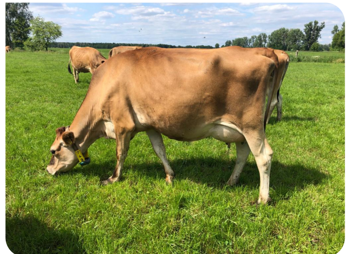
Dochter Napoleon (PP) Fig.: Ags. Bar. Urstromtal mbH & CoKG