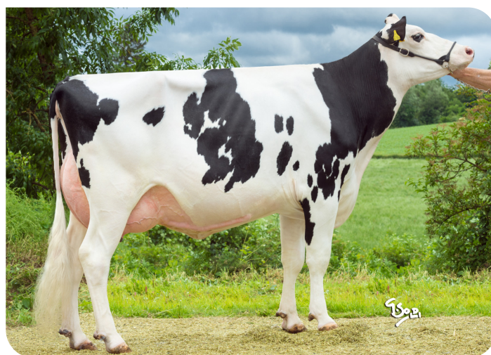
Lampedusa 425 (AB 85) (grootmoeder van Solitto)