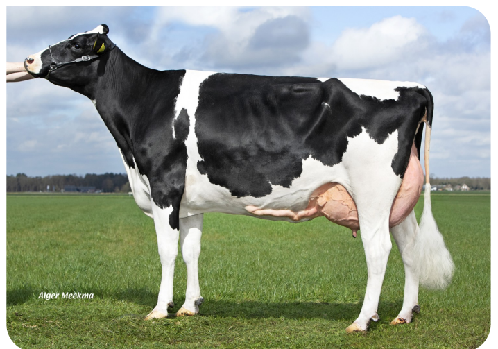
Leida 769 (v. Slash) Fig.: V.O.F. Miskotte, Den Ham (Ov.)