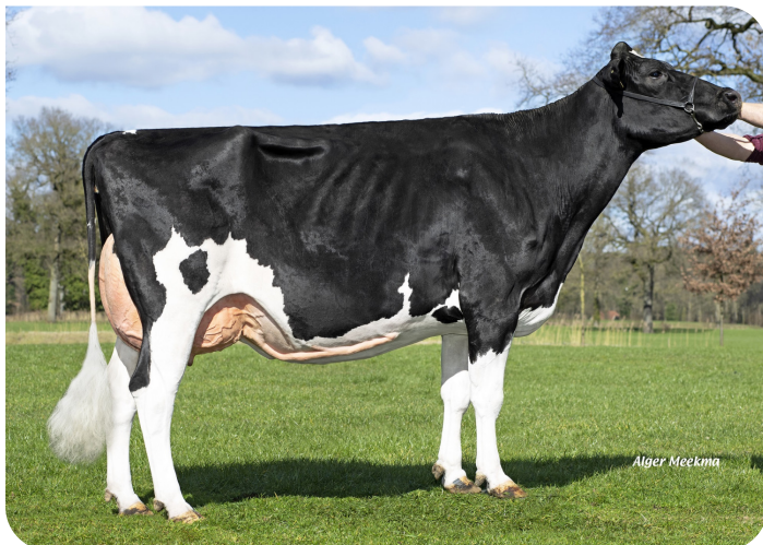
VDR Sandra 5 Moeder van Stravinsky