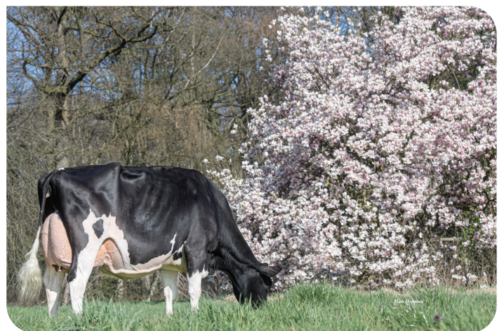
VDR Sandra 5 Moeder van Stravinsky