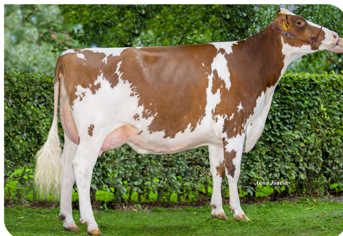
Visstein 3STAR Adiva Red (AB 87) Moeder van Iconic Red P