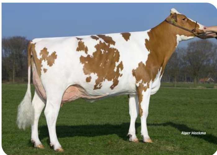
Dikkie 76 (v. Domax Red)