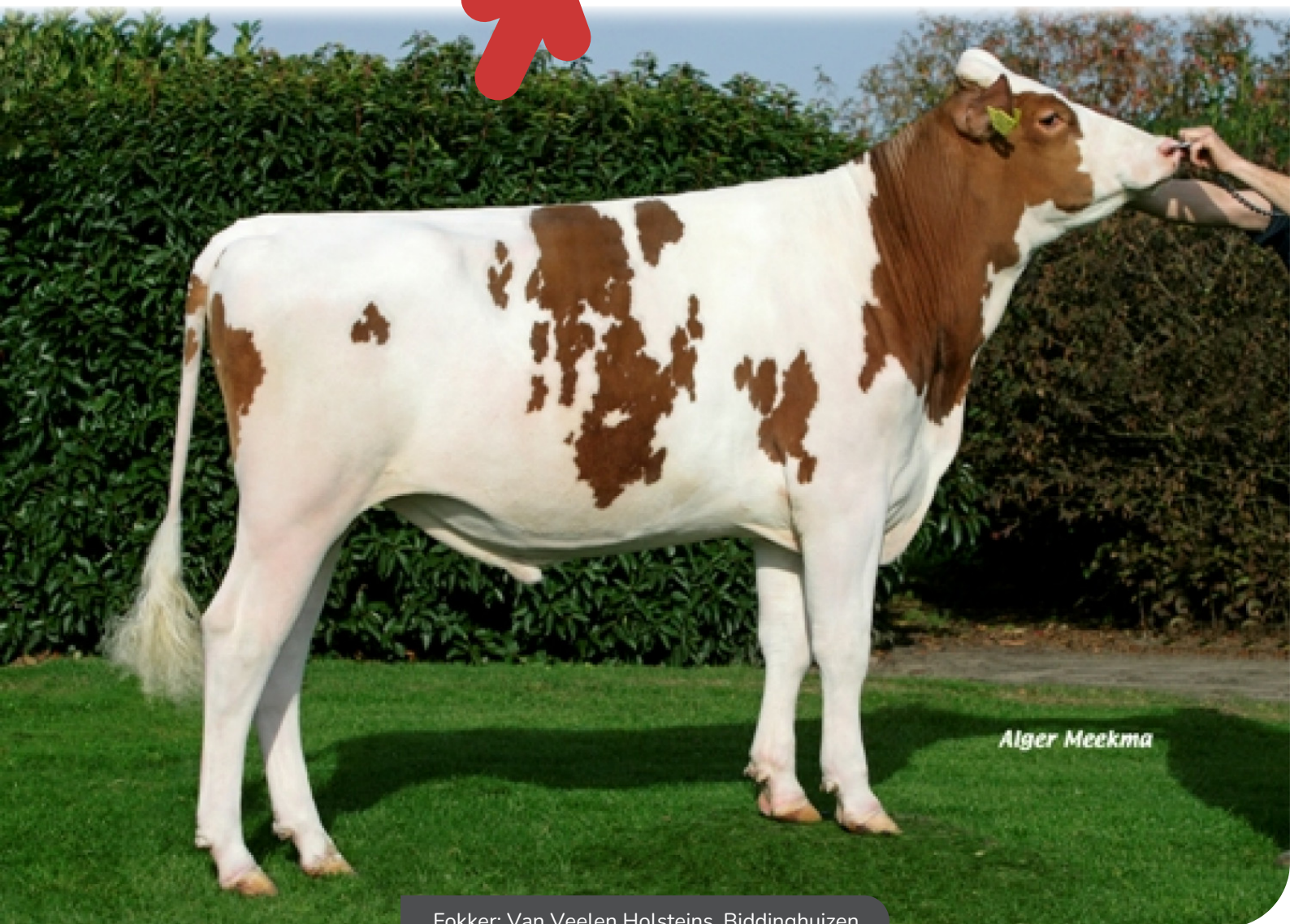
Fokker: Van Veelen Holsteins, Biddinghuizen