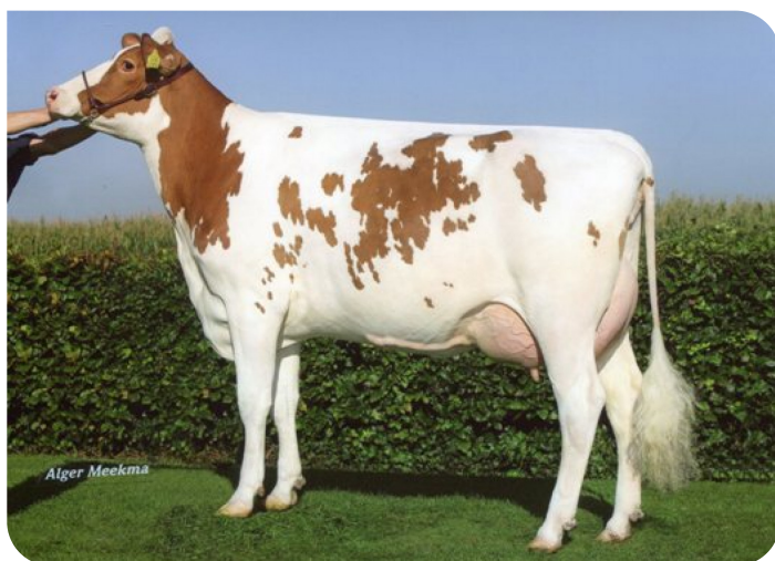
VVH Classic Maxima (AB 87) (moeder van Domax Red)