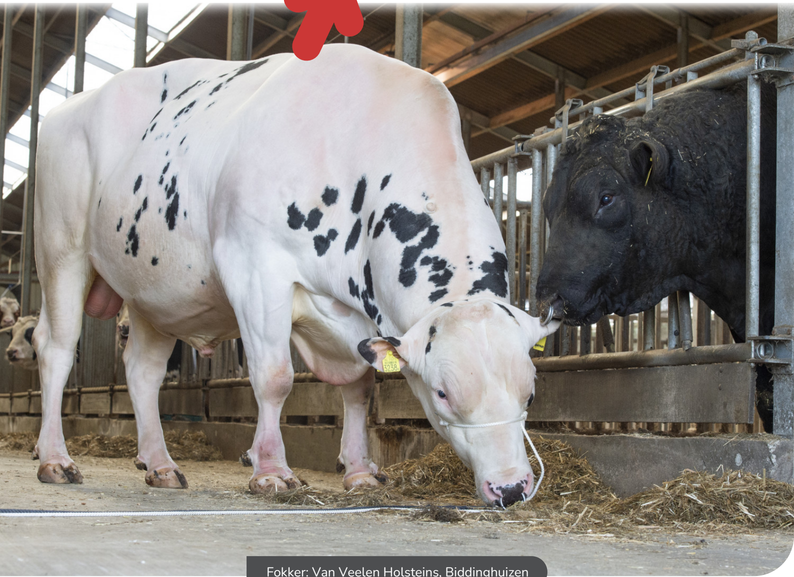
Fokker: Van Veelen Holsteins, Biddinghuizen