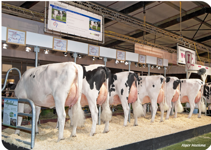
Dochtergroep Repairman Hardenberg 2018