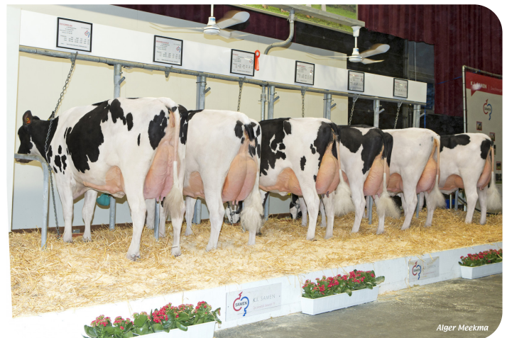
Dochtergroep VVH Repairman NRM 2019