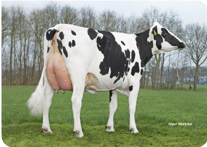
Grashoek Julia 92 (v. Repairman) Eig.: Melkveebedrijf Grashoek b.v., Grashoek