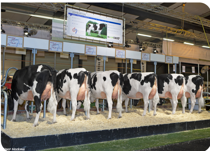
Dochtergroep Ashburton Hardenberg 2017