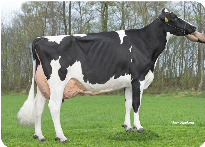
Maaïke 360 (v. Ashburton) Eig.: Vreba Melkvee B.V., Vredepeel

2.00 317dg 10702kg 4.42% 3.51% 3.00 333dg 11154kg 4.88% 3.83% 4.00 299dg 10785kg 4.96% 3.79% 5.00 338dg 15122kg 4.66% 3.55% 6.01 373dg 17976kg 4.74% 3.62% 7.05 358dg 17387kg 4.55% 3.45% 8.07 427dg 14288kg 5.43% 3.71% 91 90 89 A 90