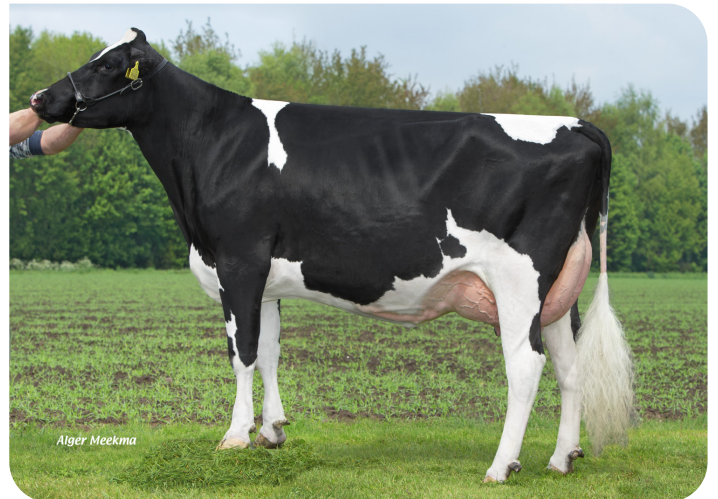
Grashoek Frida 81 (v. Ashburton) Eig.: Melkveebedrijf Grashoek b.v., Grashoek