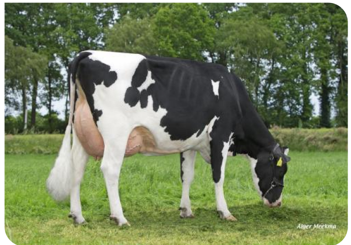
Weggelhorster Ella 36 (v. Black Velvet) Eig.: Mts. Haytink-Wichers, Lochem