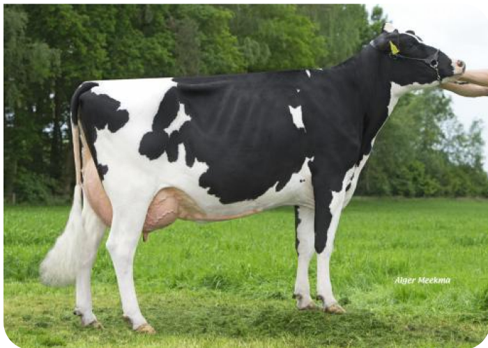
Weggelhorster Ella 36 (v. Black Velvet) Eig.: Mts. Haytink-Wichers, Lochem