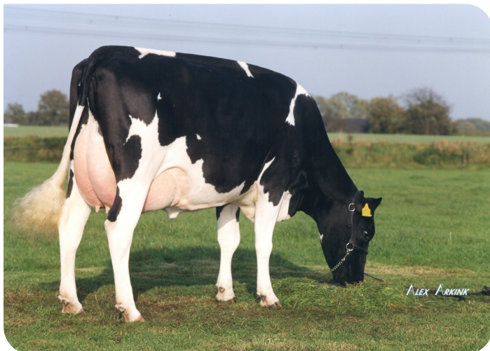
Dirndel 24 (A 90) (moeder van Black Velvet) In 2007 verkozen tot 'Beste boerenkoe van Nederland' (5e kalfs op foto)