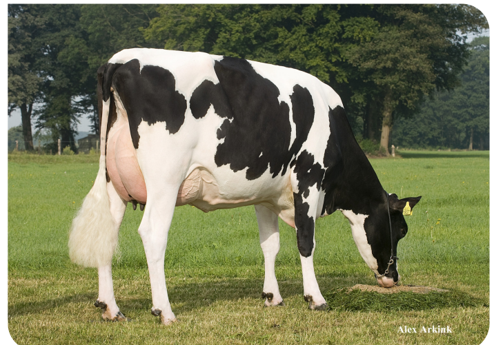
Weggelhorster Dirndel 35 (volle zus van Black Velvet)