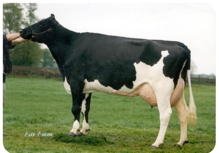
Hannita 34 (AB 89) (grootmoeder van No Doubt rf)