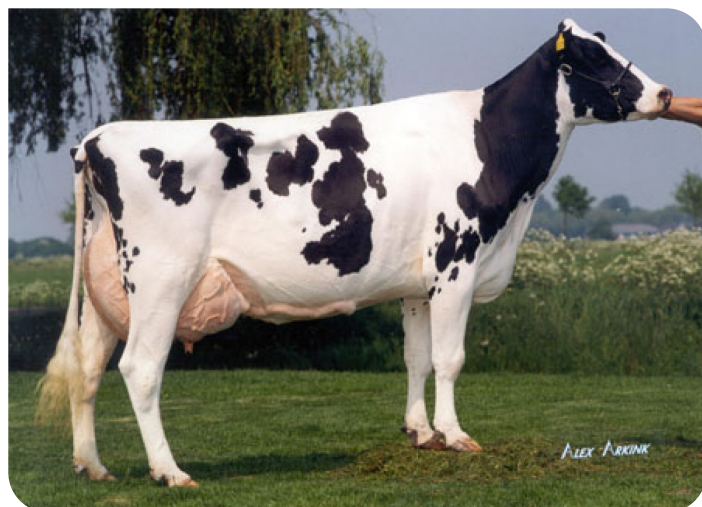
Willemshoeve Rita 221 (A 93) (overgrootmoeder van Jasper WH)