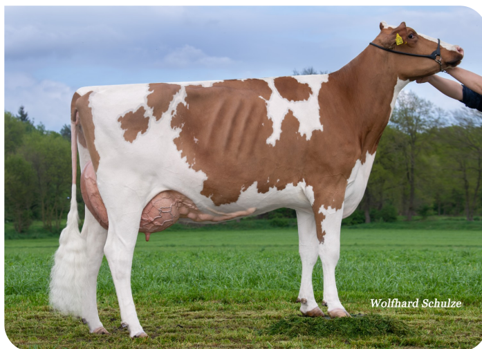
BEE Pep Mathilda N.C. (v. Pep-Red) Fig.: LOH-AN Holsteins (DE) / Bienstädt Agrar (DE)