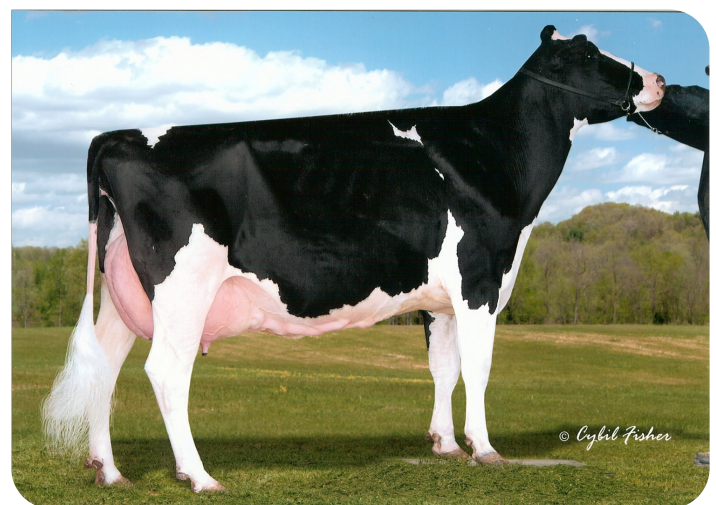
Windy-Knoll-View Profile (EX 90) (moeder van Pep-Red)