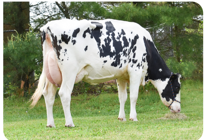
Garden-State Pep Debbie (v. Pep-Red) (VG-86 2yr) Eig.: Kevin Beiler, New Jersey, USA