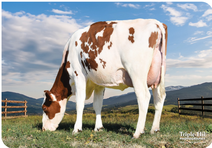
Nehls Valley Shakira Red (v. Pep-Red) (VG-85 2yr) Eig.: Shawn Nehls, Hustisford WI, USA