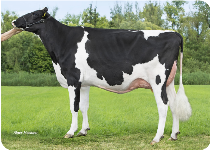
Empore 1 (v. Centrum) Eig.: V.O.F. J.J.C. de Man, Herwijnen