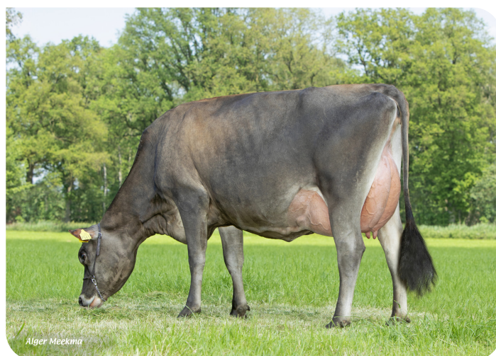
Jessy 9561 (v. Trenton Pp) Fig.: Mts. ter Mors, Haakbergen