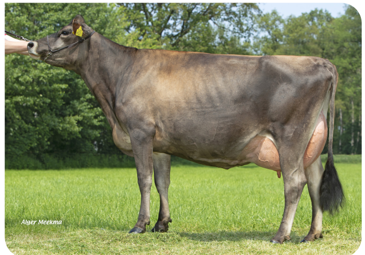
Jessy 9561 (v. Trenton Pp) Eig.: Mts. ter Mors, Haakbergen